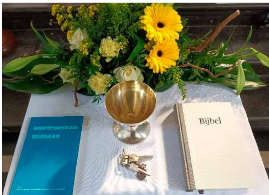
Nieuwe overste ontvangt: constituties, de kelk, sleutels en bijbel