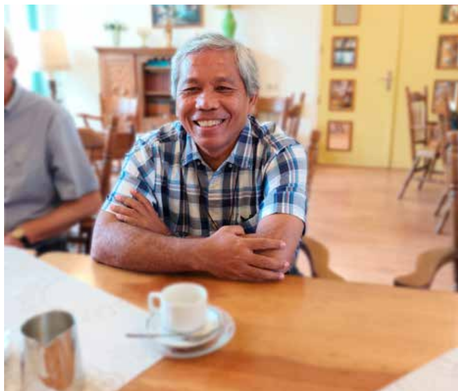
Generaal Overste Dwi Watun smm

Van 14 juli tot en met 19 juli brengt de Generaal-Overste Dwi Watun smm, samen met Generaal-Vicaris Marco Pasinato smm, een bezoek aan de Nederlandse gemeenschappen.