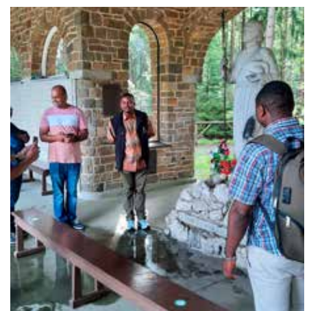
Bij het beeld van Montfort in Banneux

De volgende dag vertrokken we om 07:45 uur naar Banneux. In deze plaats hoorde ik het verhaal over de verschijning van Onze Lieve Vrouw aan een meisje. Het is interessant dat er een standbeeld staat van de Heilige Louis-Marie de Montfort. Als montfortaan ben ik altijd trots als ik beelden of schilderijen van Montfort zie in bedevaartsoorden. De ontmoeting tussen de drie landen werd afgesloten met een heilige mis en een gezamenlijke lunch. Toen gingen wij terug naar Schimmert. ■